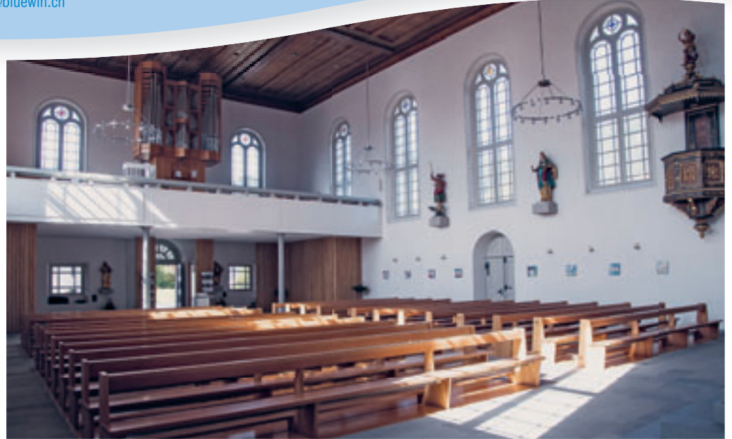
Die Hoffnung lebt, dass sich diese Bänke bald wieder füllen dürfen

Die Schülerinnen und Schüler der 2. Primarklassen wurden im Religionsunterricht sorgsam und einfühlsam an das Sakrament der Umkehr und der Versöhnung herangeführt. Am Freitagmorgen, 26. Juni, von 10.00 Uhr bis 11.40 Uhr, empfangen sie dieses erstmals im persönlichen und altersgemässen Gespräch.