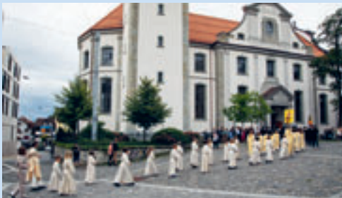
Einzug der Erstkommunionkinder

So 01.11. 14.00 Totengedenkfeier □TV mit Harfenistin, anschl. Gräbersegnung auf dem Friedhof