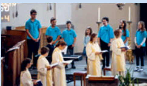
Kinderchor St. Nikolaus