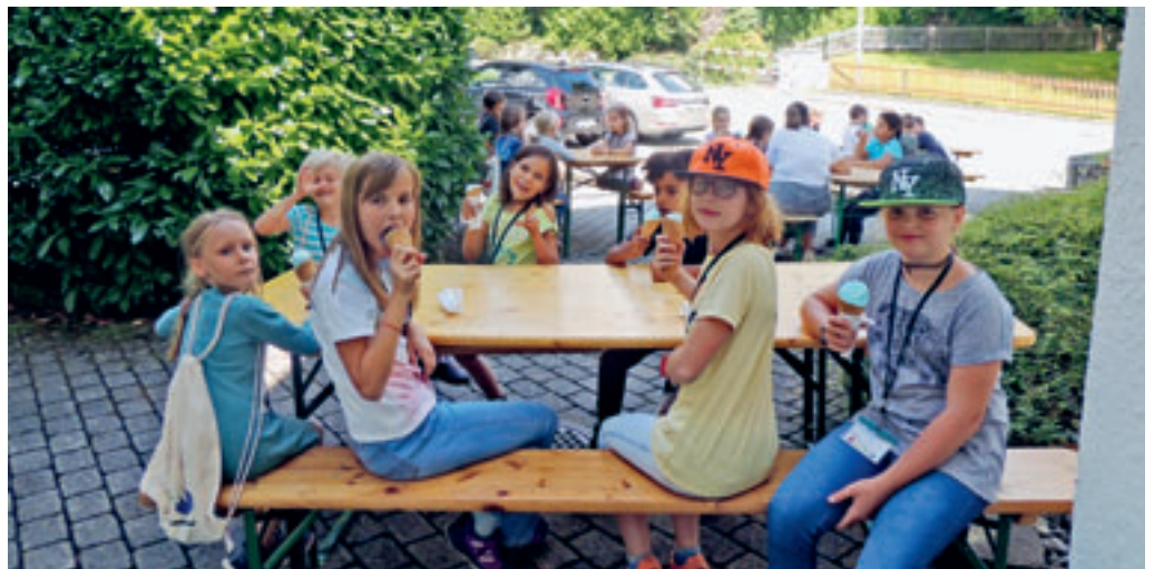
Am Samstag, 11. September, sind Kinder aus Rebstein, Marbach und Lüchingen zur ökumenischen Kinderstadt im evang. Pfarreiheim Marbach zusammengekommen. In vier verschiedenen Ateliers konnten die Kinder die Schöpfungsgeschichte hören, basteln, Rätsel lösen, singen und gestalten. Mit dem gemeinsamen ökum. Gottesdienst vom Sonntag ist der Anlass abgeschlossen worden.

Das Pfarrisekretariat ist zwischen Weihnachten und Neujahr nicht besetzt. Wir danken für Ihr Verständnis.